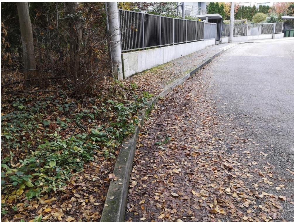
Slika 5. k.č. 2596