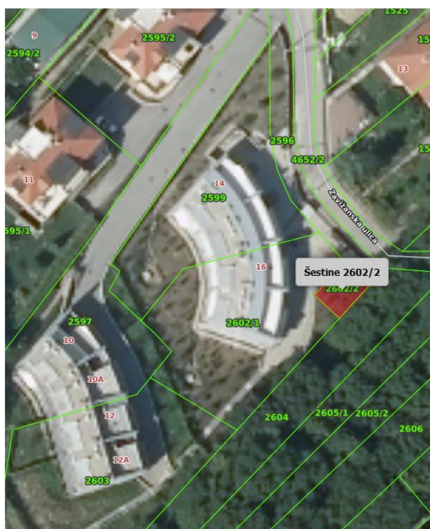
Slika 3. Katastarska čestiva 2602/2 i 2596