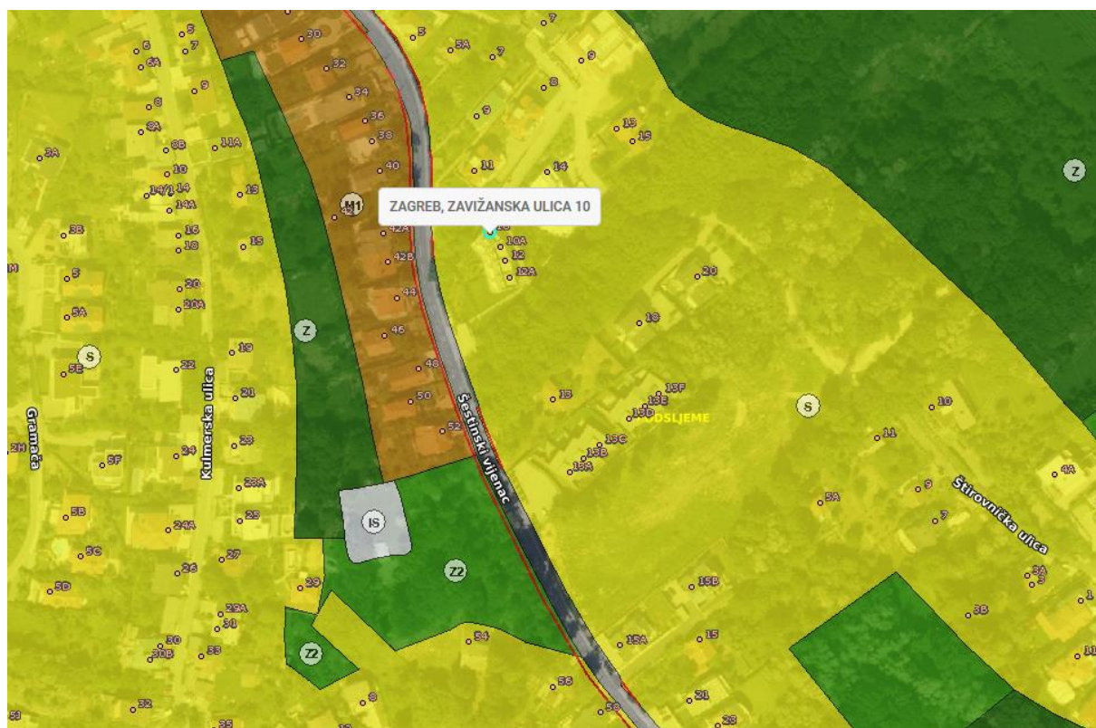
Slika 2. PPU Grada Zagreba