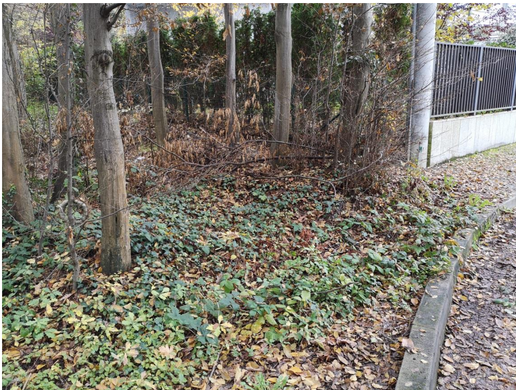
Slika 4. kč.2602/2